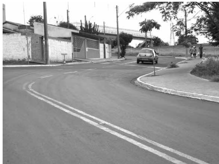
Curva acentuada se torna perigosa aos moradores

sentido para não acontecer um atropelamento". Nesta mesma rua que liga os bairros Jardim Progresso e Bela Vista, a Associação também pediu providência em relação a uma curva. Os moradores pedem para deixar em sentido de mão única.