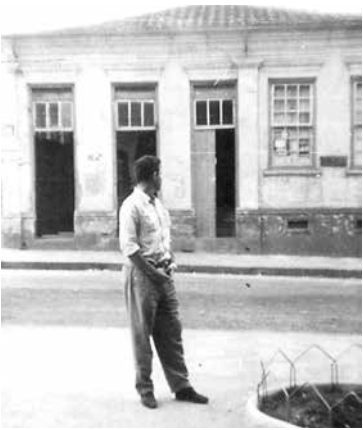
“Bar da Candinha” no ano de 1957. Hoje é a loja Bazar Ferreira

Retrospectiva dos fatos que marcaram o desenvolvimento (Págs. 06 e 07)