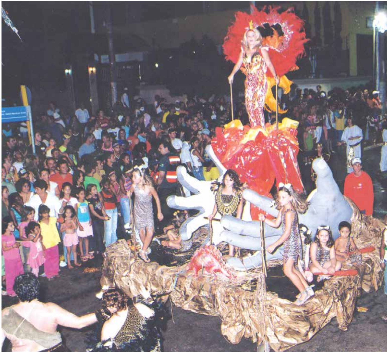
Carros alegóricos trazem beleza e requinte às passarelas do samba