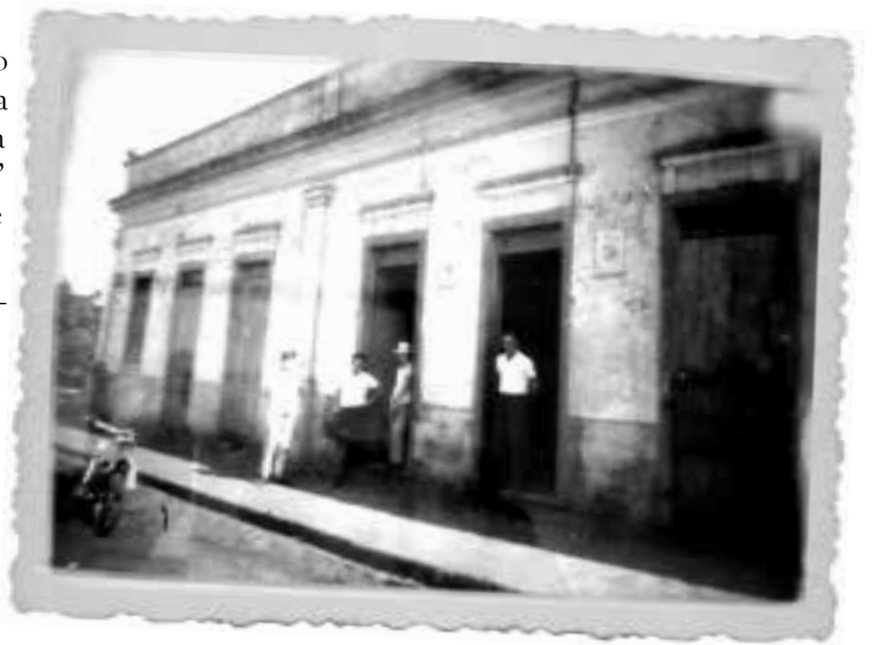
Casarão Fratini em sua época aurea usada como armazém