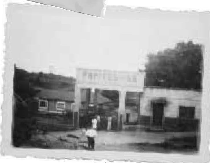
Papirus nos anos 50