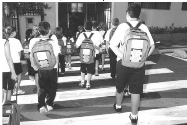
Alunos da rede municipal vão continuar a receber grátis material e uniformes grátis

e do bairro Jardim Progresso escola Professor Odécio Lucke 3546-2659 ou no departamento de educação e cultura 3546-1746 Colégio Villa Romana - Com aproximadamente cem alunos matriculados na 6ª, 7ª, 8ª e 9ª séries e no 3º colegial, as aulas retornam no dia 28 de janeiro. Mais informações pelo telefone (19) 3546-5215 ou pelo site vilalaromana@terra.com.br . APAE - Os mais de 150 alunos retornam dia 15 de fevereiro. Mais detalhes pelo telefone (19) 3546-2189 e 3546-6400. Santa Gertrudes Colégio SOE - Os 250 alunos, desde a educação infantil ao 3º colegial do sistema positivo de