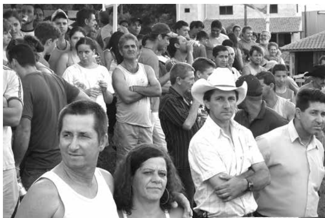
Forte presença do público prestigiando o evento nas montarias em touros

Para o treinamento, os tropeiros trazem touros robustos e fortes de municípios vizinhos para o esporte. Du-