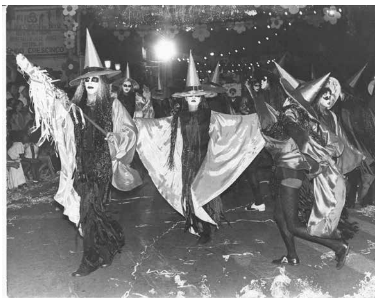
“Turma do Ligão” fantasiados de feiticeiros em 1974

Se os anos 50 foram marcados pelo conservadorismo do pós-guerra e os 60 pela primeira invasão britânica no pop, os anos 70 chacoalharam todas as estruturas, foi a década de uma movimentada cena alternativa, da radicalização de experiências comportamentais. Era a época dos famosos sapatos plataforma, das calças boca-de-sino, das meias de lúrex, do poliéster e dos signos do zodíaco. Cordeirópolis também vinha com a modernidade e transformação, trazia às ruas o fascínio da alegria do Carnaval.