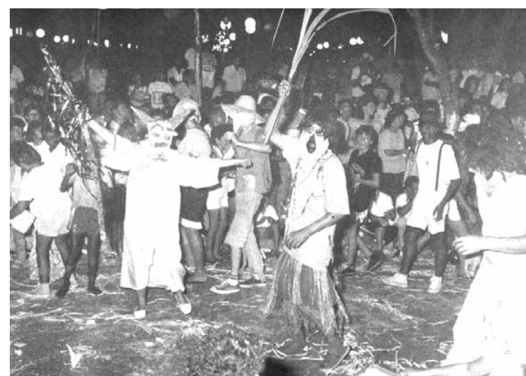
Bloco “Unidos da caninha”